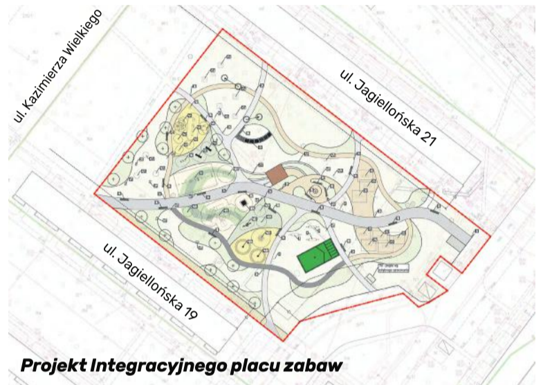
Projekt Integracyjnego placu zabaw

Flaga to symbol, który jednoczy, zauważa Marcin Podśędek , wiceprzewodniczący sejmiku województwa mazowieckiego, jednocześnie zachęcając do jej eksponowania. – Wywieszając flagę Mazowsza poka-